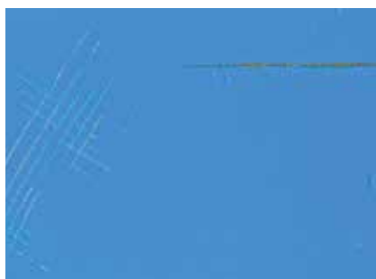
480 HORAS NIEBLA SALINA

El Esmalte URKI-NATO está clasificado como M-1 por un Laboratorio externo homologado según UNE 23727:1990.