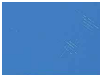
240 HORAS CÁMARA HUMEDAD