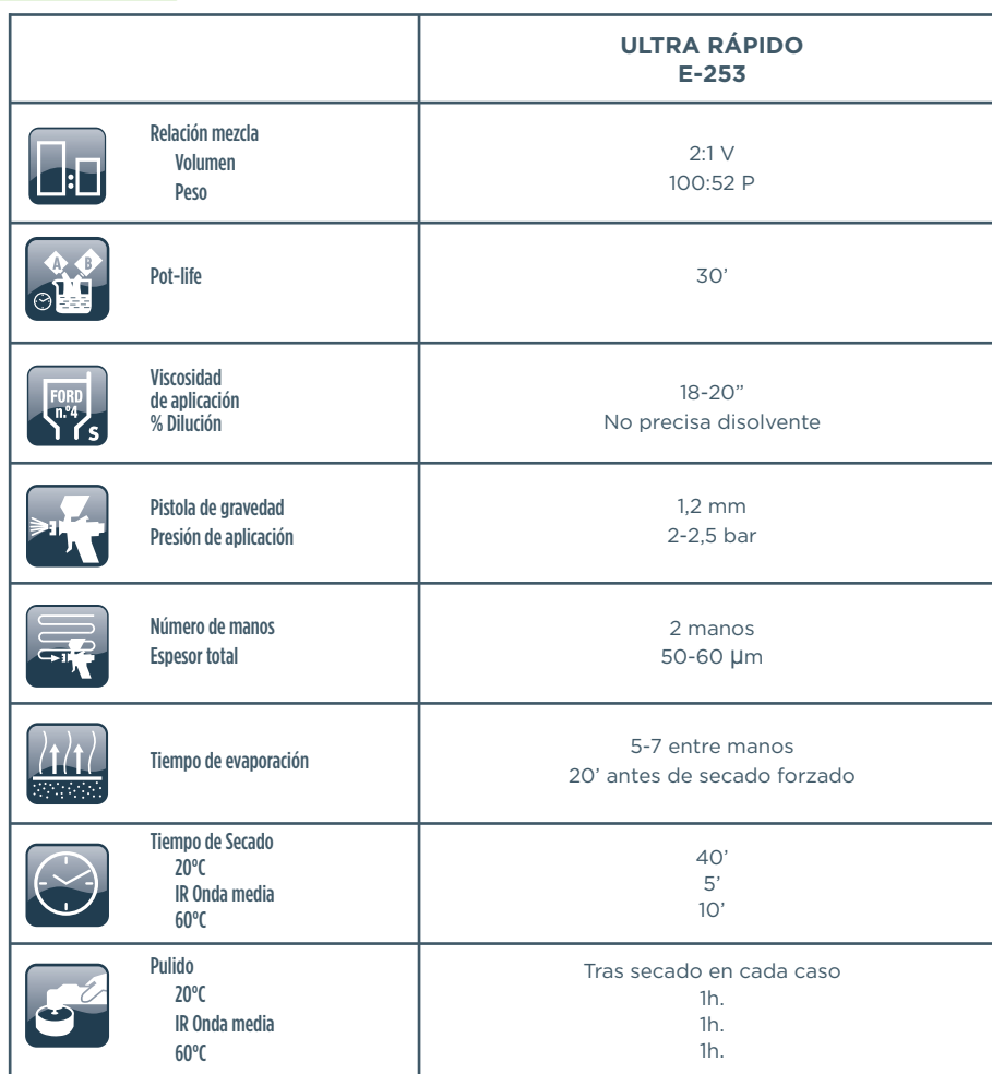
TABLA DE MEZCLAS